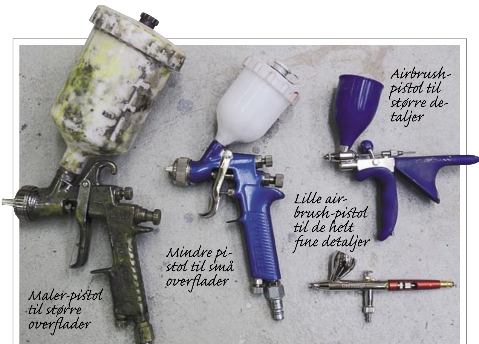
Maler-pistol til større overflader