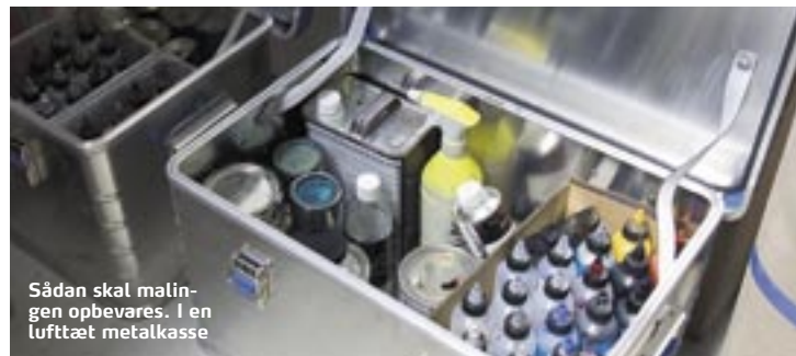
Sådan skal malingen opbevares. I en lufttæt metalkasse

Hvis du selv skal i krig med at lave airbrush på bilen, motorcyklen, lastbilen, styrthjelmene, scooteren, campingvognen, eller hvad du nu finder på, så er det vigtigt at have det rigtige udstyr, inden du går i gang. Ivar Åslund anbefaler en sprøjtepistol (altså selve airbrush-pistolen) til et par tusinde kroner, da den holder længere og giver bedre resultat end en til 300 kroner. En kompressor kan fås fra 500 kroner, og malingen skal være fortynderbaseret, da det er bedst at arbejde med. Priserne varierer meget, men alt i alt kan du starte din airbrush-karriere op for 3-4.000 kroner. Som du kan se til højre, skal malingen opbevares ordentligt, da det er noget giftigt stads. Så husk også åndedrætsværn! Køb airbrush-ting her: www.aartdevos.dk / www.starpaint.dk