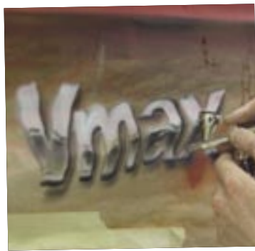
Her lægges et sort mønster i bunden, så der skabes dybde og effekt. Brug fantasien!