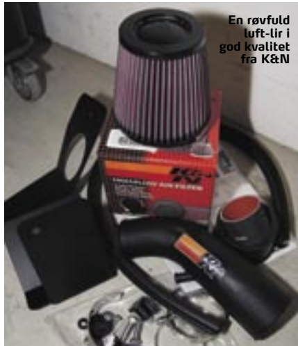
En røvfuld luft-lir i god kvalitet fra K&N

Vi ser det i alle tunede og stylede biler. Jeps, et luftfilter er næsten standardudstyr i biler med power og stil. Et eftermonteret luftfilter er nemlig den nemmeste og billigste måde at give din motor mere karakter på. Det giver både bedre åndedræt, hvilket giver bedre effekt, men det giver også en helt anden lyd, når du træder speederen i bund. Bilen suger pludselig luft på en helt anden og mere aggressiv måde. Det fedest er dog, at det kan monteres for relativt få penge – og det er ikke svært at gøre hjemme i garagen. Vi monterer et færdiglavet K&N 57i Performance Kit på Ronnis Chrysler PT Cruiser 2,0. Nemmere bliver det virkelig ikke, så prøv evt. selv.