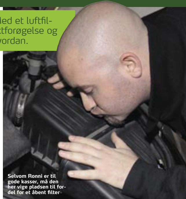
Selvom Ronni er til gode kasser, må den her vige pladsen til fordel for et åbent filter